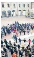
Il ballo in cerchio tipo Harkada sarà replicato