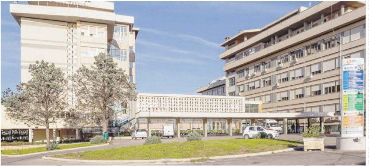
L'ospedale prende il nome dal medico e politico italiano Vito Fazzi, che fece costruire il plesso nel 1887

La proprietà intellettuale è riconducibile alla fonte specificata in testa alla pagina. Il ritaglio stampa è da intendersi per uso privato