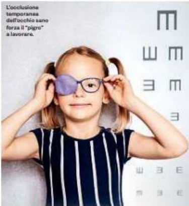
L'occlusione temporanea dell'occhio sano forza il "pigro" a lavorare.

L'"occhio pigro" (o ambliopia) riguarda circa un bambino su 30 e se non viene trattato nei primi anni di vita diventa irreversibile. «Lochio è "pigro" per un'alterazione della trasmissione del segnale visivo al cervello - spiega Lelio Sabetti, professore di malattie dell'apparato visivo dell'università dell'Aquila - che privilegia l'utilizzo di un occhio, per la ridotta capacità di messa a fuoco dell'altro, ad esempio per miopia, astigmatismo o ipermetropia. Altre cause sono la cataratta congenita, la ptosi o palpebra calata o lo strabismo. Il disturbo insorge alla nascita e progressivamente si sviluppa, fino ai 6-7 anni quando si completa la maturazione del sistema visivo. Se non si effettua un esame della vista precoce è difficile accorgersene finché il bambino non va a scuola. Intercettare il problema entro i 3-4 anni, invece, offre maggiori possibilità di recupero».