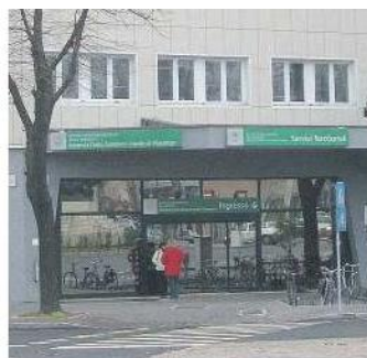
L'Ausl a piazzale Milano