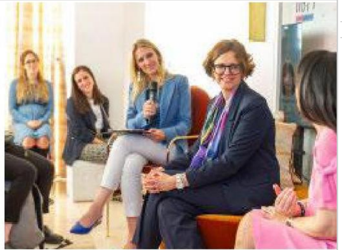
L'ospedale Sant'Anna di Torino ha ottenuto il «Bollino Rosa» dalla Fondazione Onda ets

Con il contributo incondizionato di Vichy nell'ambito del progetto etico «Hormonall», un programma di formazione dedicato all'impatto delle variazioni ormonali sul benessere delle donne.