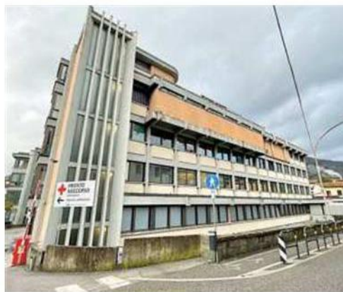
Uno scorcio del padiglione centrale dell'ospedale Cosma e Damiano di Pescia