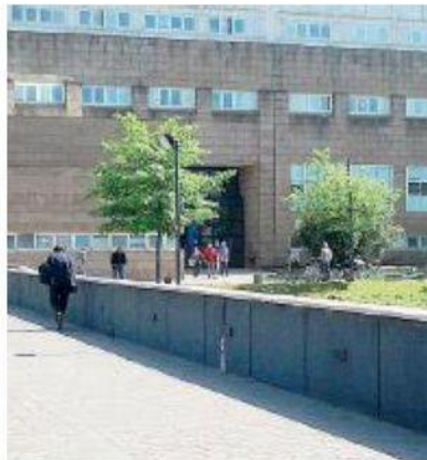
Bollino rosa L'ospedale della Gruccia

In provincia di Arezzo ad aderire alla prima edizione promossa dalla Fondazione Onda Ets è l'ospedale del Valdarno con visite mediche gratuite. La giornata, con oltre 160 ospedali italiani bollino rosa