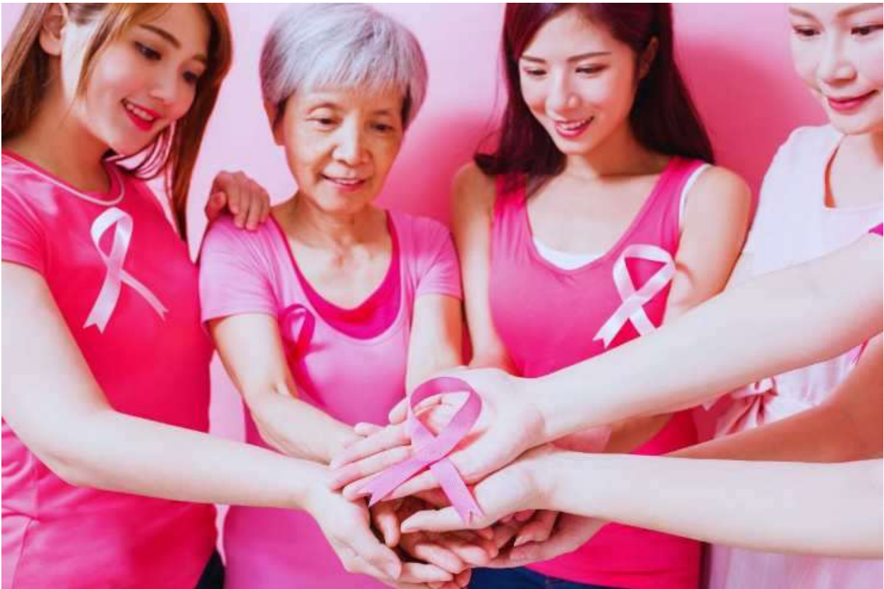
OPEN DAY PREVENZIONE AL FEMMINILE

Non meno importante sarà l'attenzione rivolta alla salute mentale. Saranno infatti disponibili consulenze psicologiche e colloqui psichiatrici sia in presenza che online, grazie alle Usd di Psicologia clinica di Borgo Trento e Borgo Roma e dalla Uoc di Psichiatria B. L'intento è quello di offrire un supporto completo alle donne, considerando non solo gli aspetti fisici ma anche quelli psicologici che possono influenzare il benessere generale.