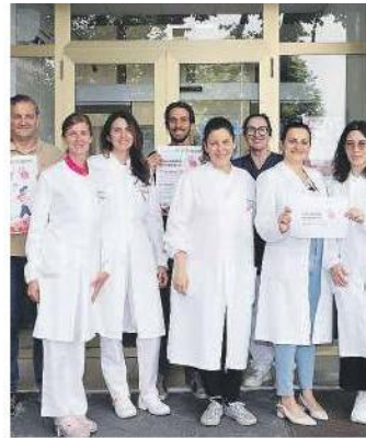
I medici impegnati nella giornata