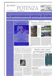
La locandina dell'iniziativa

La proprietà intellettuale è riconducibile alla fonte specificata in testa alla pagina. Il ritaglio stampa è da intendersi per uso privato