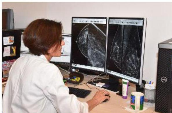
Visite mediche e vaccinazioni gratuite per l'Open day Prevenzione al Femminile all'ospedale del Valdarno

no per le prenotazioni, lo 055/9106590, ma giorni e orari diversi: nel primo caso l'agenda si aprirà lunedì prossimo per chiudersi venerdì 14 giugno e gli appuntamenti sono possibili dalle 9 alle 12; nel secondo gli utenti possono già chiamare dalle 8.30 alle 12.30.