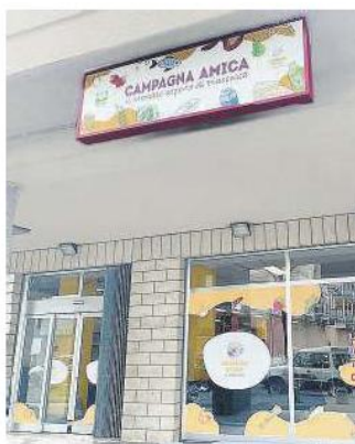
La sede degli incontri