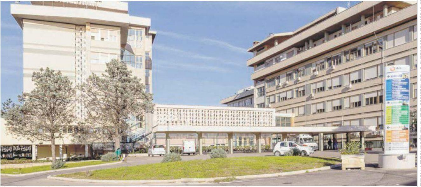
L'ospedale prende il nome dal medico e politico italiano Vito Fazzi, che fece costruire il plesso nel 1887

La proprietà intellettuale è riconducibile alla fonte specificata in testa alla pagina. Il ritaglio stampa è da intendersi per uso privato