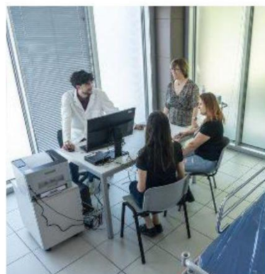
Servizi gratuiti per ragazze e donne: numerose le proposte dell'Open Day dedicato alla prevenzione al femminile