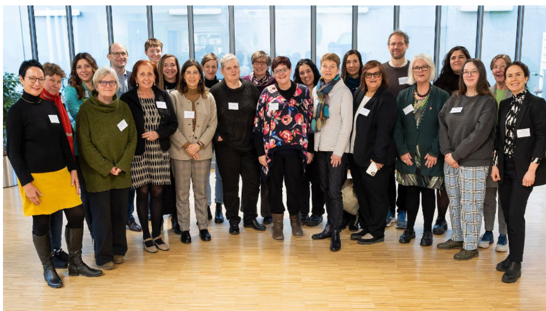
Foto di gruppo del consorzio del progetto UE VIPROM: 23 partecipanti hanno preso parte all'incontro di avvio sulla protezione delle vittime di violenza domestica in medicina presso l'Università di Muenster in Germania.